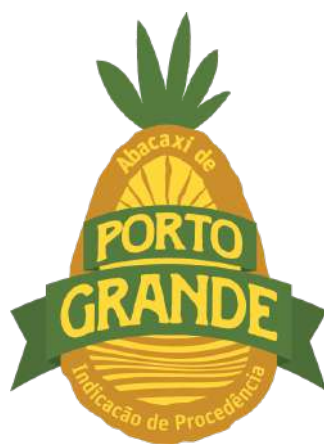
Figura 02 - Representação gráfica da IG a ser aplicada para os padrões de comercialização do abacaxi.

A representação gráfica e figurativa da Indicação de Procedência “PORTO GRANDE” para o Abacaxi, com distintivo gráfico do tipo misto, de titularidade dos produtores estabelecidos no território delimitado e coordenada pelo Conselho Regulador da Associação dos Produtores de Abacaxi de Porto Grande está assim definida: