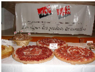
Sesión de degustación de productos con IG durante la Asamblea General Extraordinaria

Europa Oriental y Occidental revisaron las actividades llevadas a cabo por OriGIn durante los meses pasados. Intercambiaron puntos de vista sobre la importancia de explicar el concepto de IG a nivel mundial y asegurar una mejor protección de las IGs a todos los niveles, con la presentación de destacados ejemplos como las Manzanas Shanxi de China, el Aceite Argan de Marruecos o el Café Colombiano, entre otros.