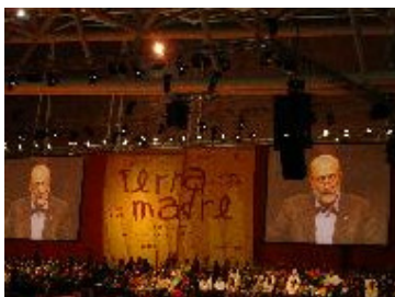
Terra Madre 2006, Turín (Italia)

se ven frecuentemente transgredidos por firmas que abusan y libremente utilizan la reputación de famosos productos locales. Esta conducta no solo tiene efectos devastadores sobre los productores quienes trabajan arduamente para mantener un alto nivel de calidad mientras preservan el saber-hacer local, sino que también confunde al consumidor sobre el origen de los bienes. OriGIn cree que una mejora en la protección de las Indicaciones Geográficas asegurará una adecuada protección de la calidad y los productos tradicionales, en beneficio tanto de los consumidores como de las comunidades locales; de lo contrario, sin una fuerte protección de las IGs, el futuro de las indicaciones geográficas está en peligro!